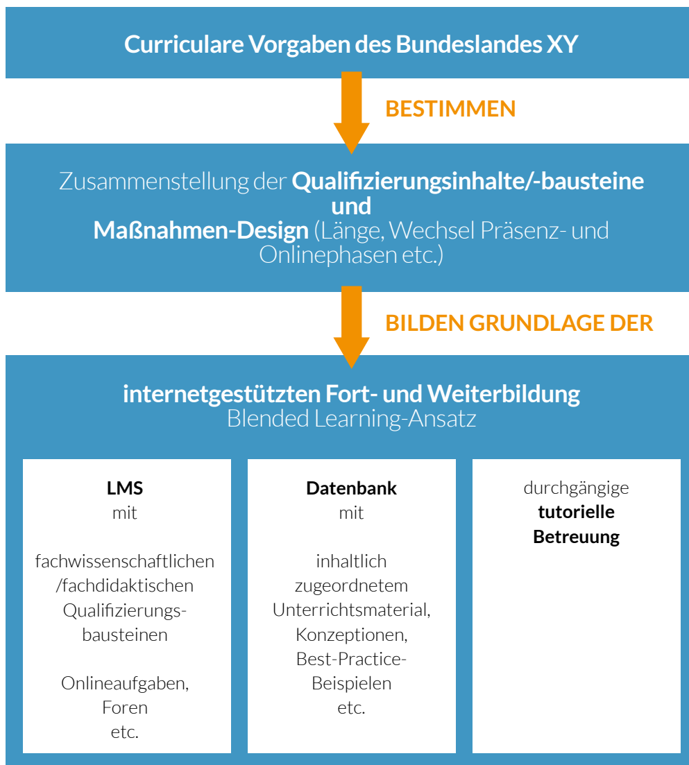
Abbildung 1: Konfiguration von Qualifizierungsmaßnahmen

Der Gesamtzusammenhang lässt sich wie folgt darstellen: